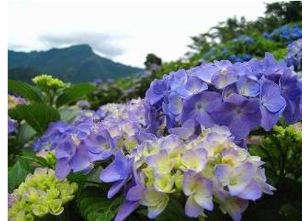
紫陽花と八面山（やつらさん）