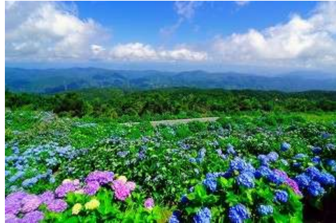
大川原高原の紫陽花