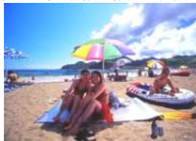
田井ノ浜海水浴場（美波町）