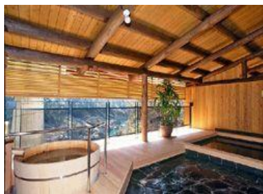
【大歩危峡まんなか】