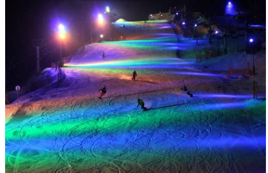
【井川スキー場 腕山→ リンク 】