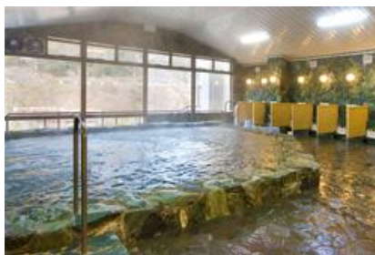
【月ヶ谷温泉月の宿】